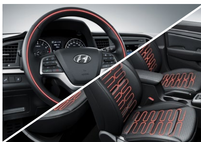
Pakiet zimowy - 1000 zł