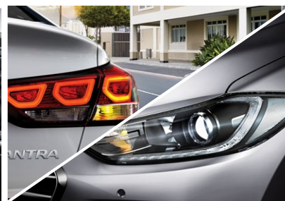
Pakiet ksenon - 3500 zł