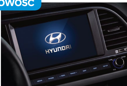
Nawigacja - 2990 zł